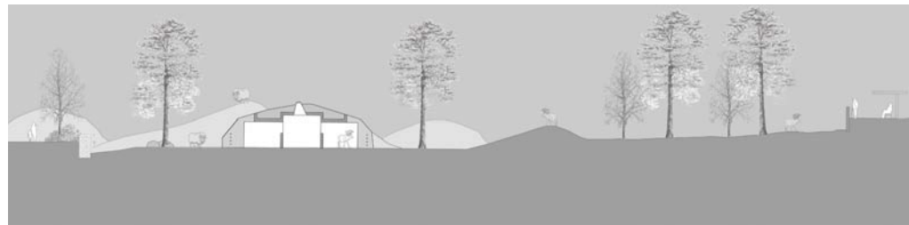
Querschnitt durch die neue Anlage

Öffentlicher Projektwettbewerb - Anlagen für Papageitaucher, Moschusochsen, Rentiere und Eisfuchs