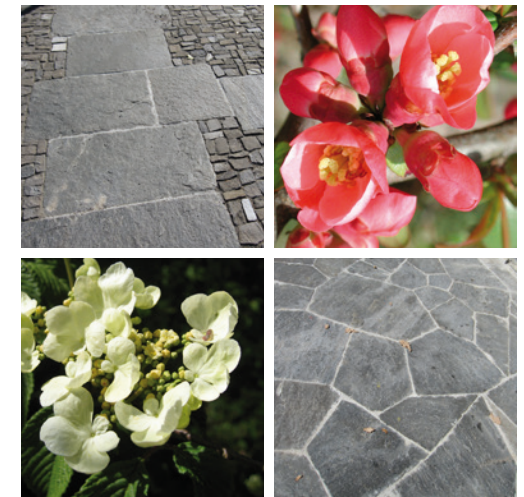
Zeittypische Pflanzenvielfalt und Natursteinarbeiten