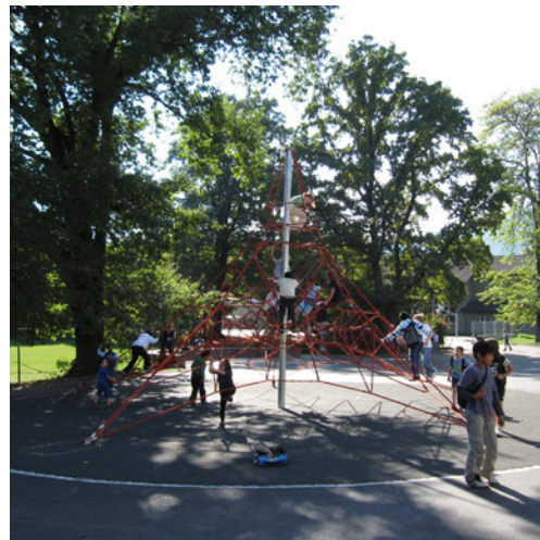
Kletterpyramide auf dem Pausenplatz

Die von Gustav Ammann gestaltete Umgebung des Wollishofer Schulhauses musste inklusive Kanalisation vollständig erneuert werden. Die inventarisierte Anlage war nach Ammanns Grundkonzept mit Natursteinmauern, Natursteinbelägen sowie reichen Baum- und Staudenpflanzungen wieder aufzubauen. Die ursprünglichen Raumbezüge wurden durch Gruppen von Robinien auf dem Pausenplatz wieder hergestellt. Die für Ammann so typischen vielfältigen Staudenbeete mit Kleinsträuchern wurden wieder gepflanzt. All diese kleinteiligen Elemente bieten den Kindern ruhige Rückzugsräume und bilden einen wohlthuenden Kontrast zu den weiten Asphalt- und Wiesenflächen. Neue Spielgeräte und ein Pausenpavillon verbessern das Angebot.