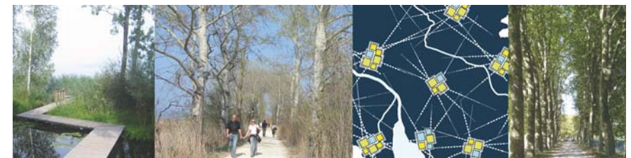
Parkzellennetz: Erholungsräume für die siedlungsnaher Naherholung realisieren und vernetzen