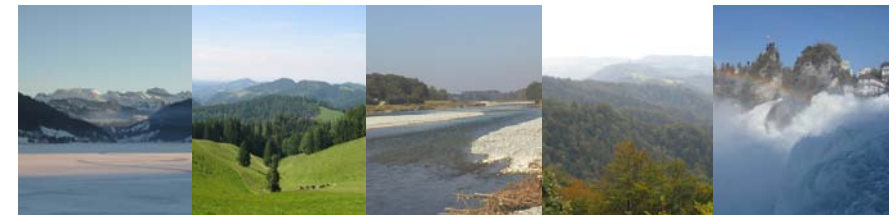
Charakterlandschaften: 12 Landschaften zeigen die typischen landschaftlichen Highlights des Raumes auf