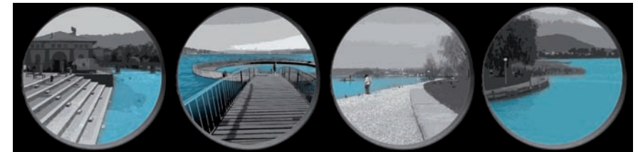
Wasserlandschaften: Gewässer auch als Erholungsräume durchgängig vernetzen