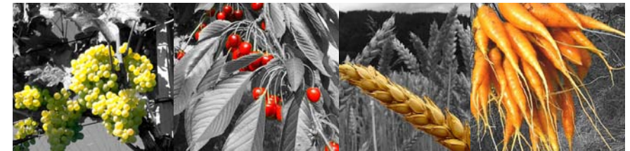
Regionale Spezialitäten: Typische Kulturlandschaften und regionale Produkte gemeinsam fördern