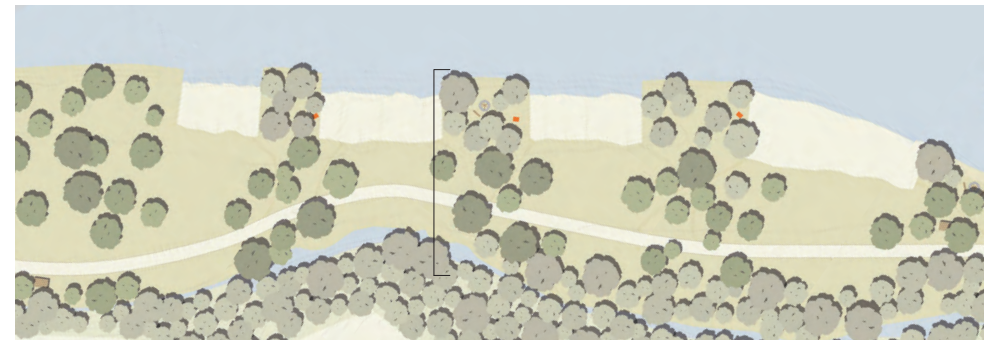
Ausschnitt: Badebuchten mit Flachufer. Lockerer Baumbestand strukturiert den Raum

Ausgehend vom Vorprojekt „Hochwasserschutz und Renaturierung Kleine Emme und Reuss“ initiiert der Kanton Luzern eine Testplanung für die zwei Erholungsschwerpunktgebiete Buchrain und Emmen.