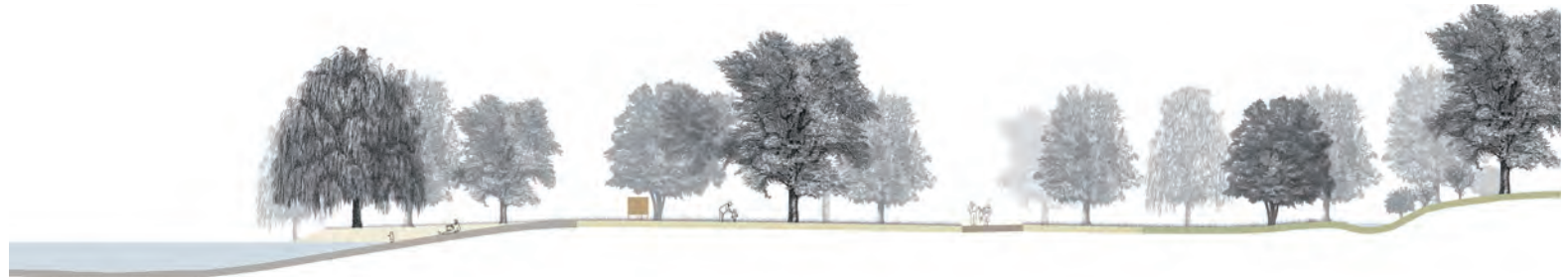
Schnittansicht: Badebucht mit Flachwasserzone, locker bestandener Baumhain, breiter Fuss- und Radweg und Naturschutzzone mit Bachlauf

Testplanung Erholungsschwerpunktgebiete Buchrain und Emmen Vertiefung Buchrain