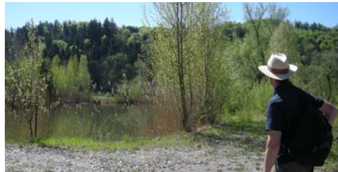
Vegetationsaufnahme im Schmerkner Riet

Zeitraum: 2014 Auftraggeber: Koko hotspots Linthebene