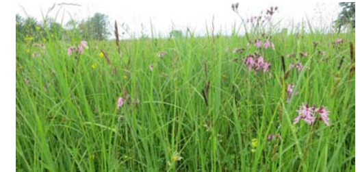
Kuckuckslichtnelke im Niederriet

Im Hinblick auf zukünftige Schutz- und Aufwertungsmassnahmen wurde im Juni 2014 der Ist- Zustand der Vegetation in den Gebieten Niederriet, Schmerikoner Allmend und Bätzimatt erhoben. Dabei wurden die Vegetations-einheiten, die prioritären Pflanzenarten nach Vorgaben BAFU und Rote Liste, sowie das Neophytenvorkommen innerhalb des Flachmoorperimeters kartiert. Weiter wurde der Vernässungsgrad der Wiesen ausserhalb des Flachmoorperimeters mithilfe der Abundanz bestimmter Zeigerpflanzen für Vernässung aus dem Genus Carex (Seggen) kartiert. Empfehlungen für die zukünftige Pflege wurden formuliert.