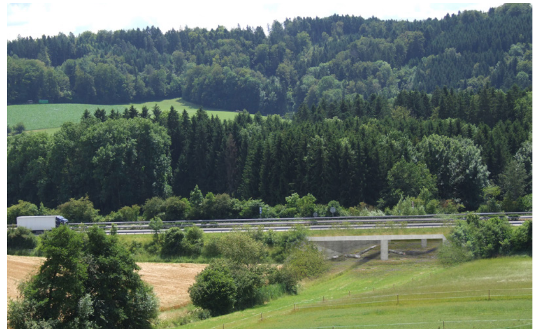
Situation, Schnitt und Visualisierung Bestvariante Unterführung LU12 Knutwil

Auf der A2 zwischen Reiden und Sursee im Kanton Luzern trennt die Nationalstrasse drei Wildtierkorridore von überregionaler Bedeutung.